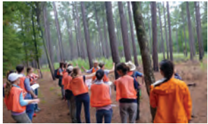
DUKE FOREST DURHAM, NC