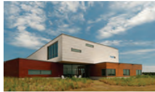
DUKE MARINE LAB BEAUFORT, NC