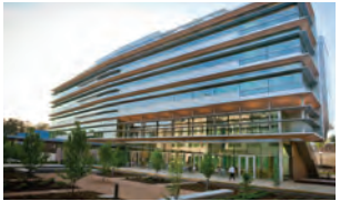
ENVIRONMENT HALL Y LSRC DURHAM, NC